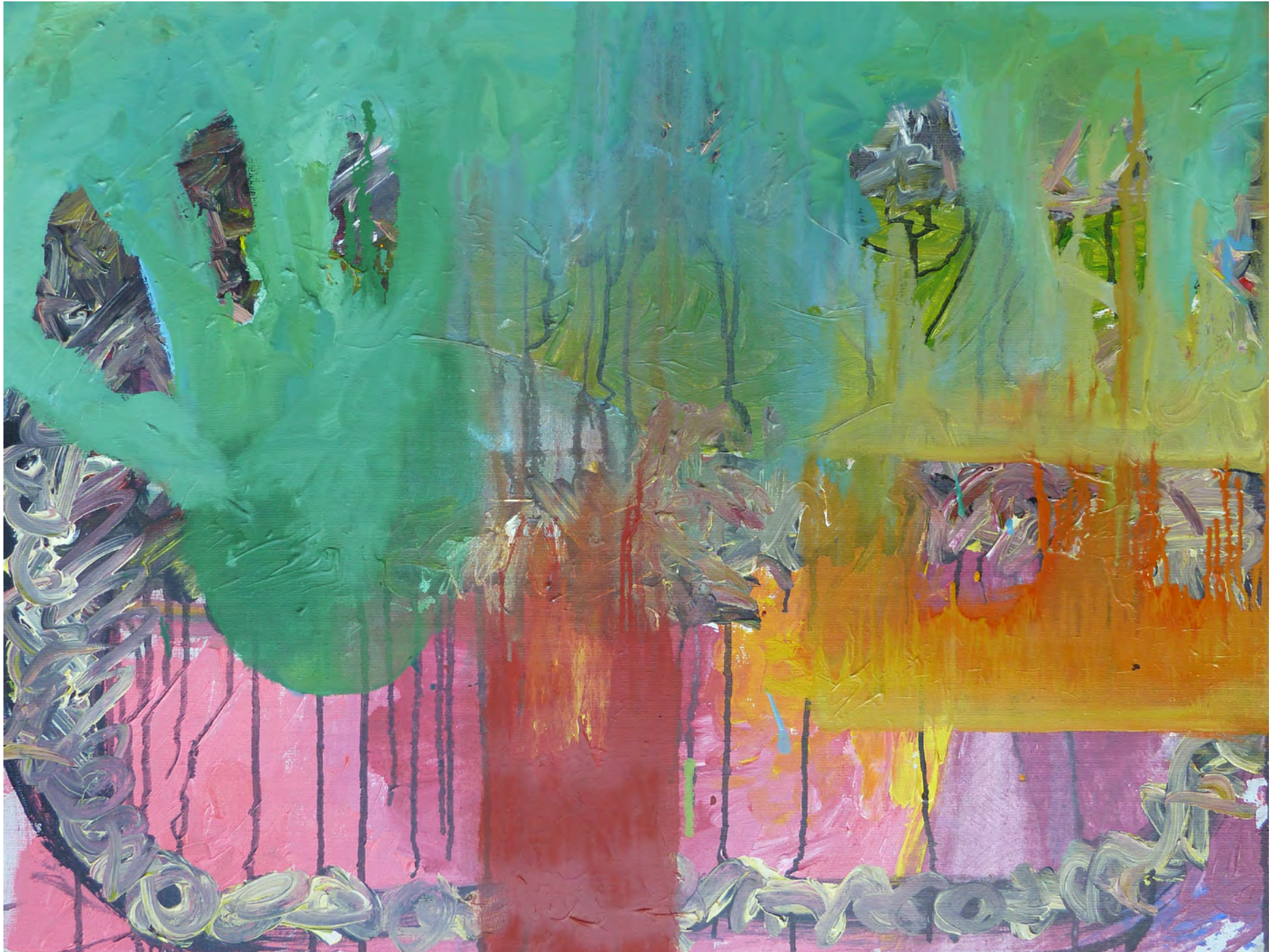
WELT, VOM HAHN AUS GESEHEN, Oil and Acrylic on Canvas, 80 x 60 cm, 2012