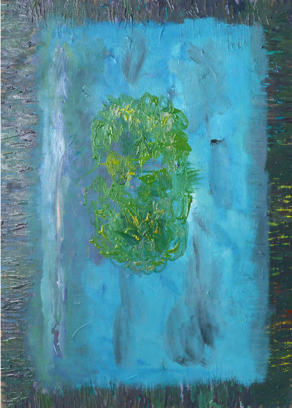
OT VIII, Oil on Canvas, 50 x 70 cm, 2012