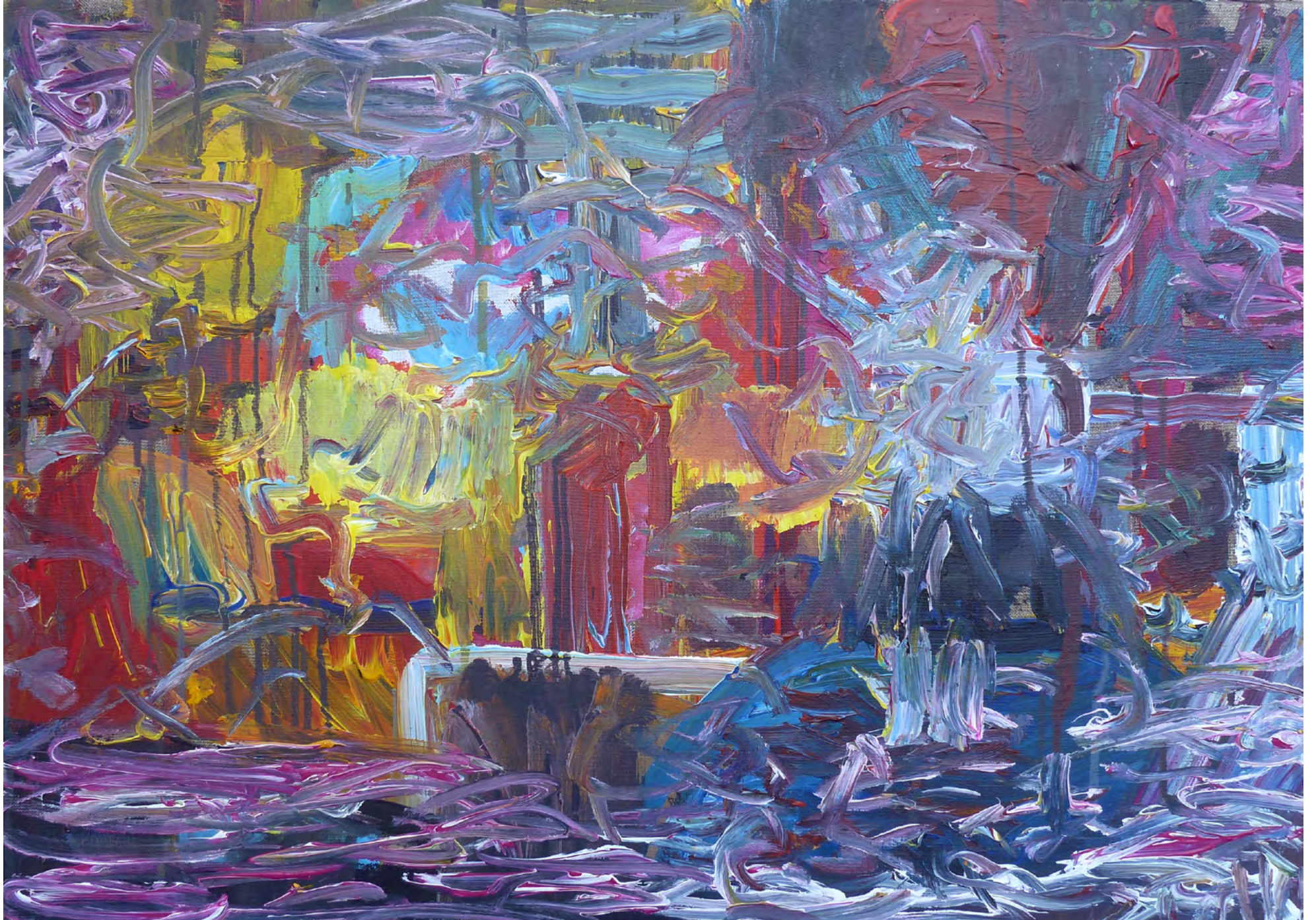
OT IX, Acrylic on Canvas, 70 x 50 cm, 2012