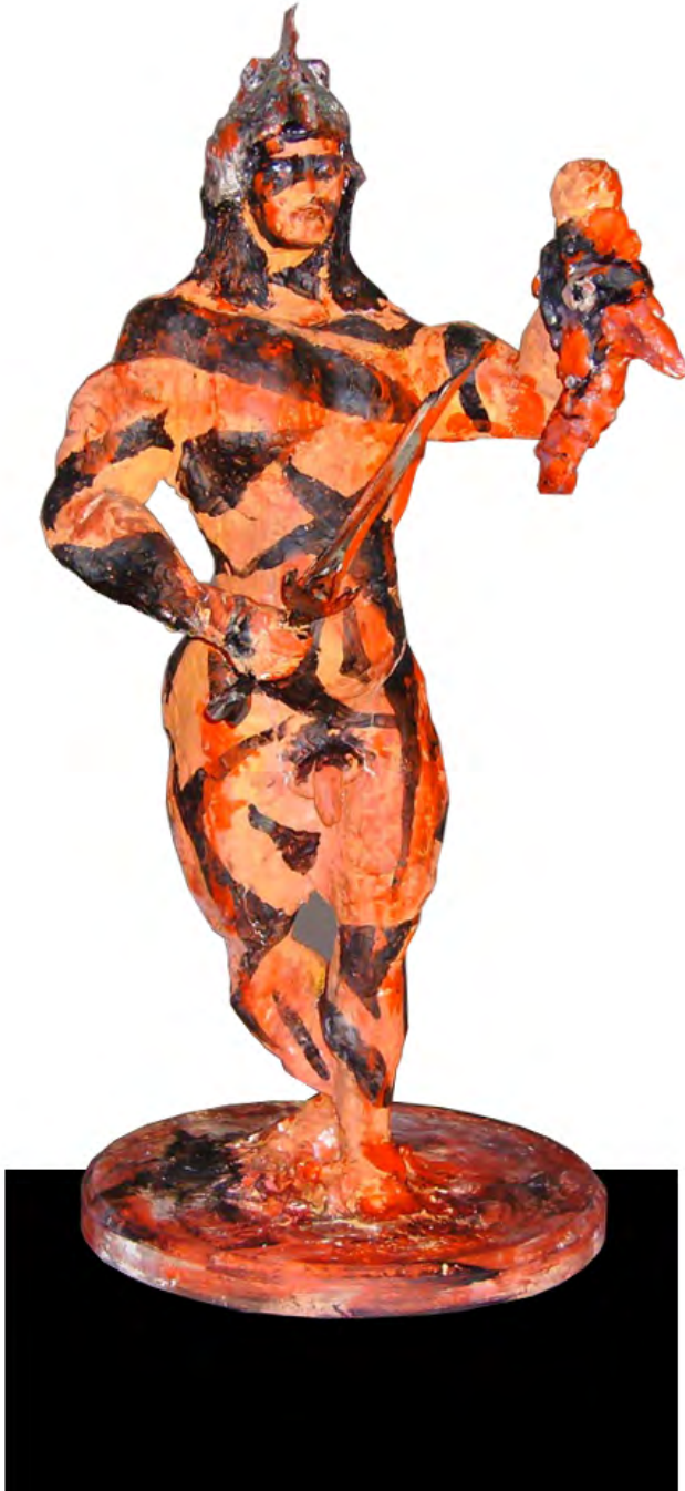
Phillip Zaiser, JOHN TIGER zeigt: KONAN, KOCKWARRIOR, PUSSYHUNTER Plaster, modelling paste, acrylic on wood, 45 x 45 x 150 cm, 2012