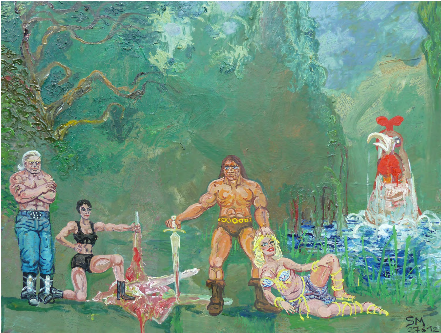
JAGDGESELLSCHAFT MIT HAHN, Oil on Canvas, 80 x 60 cm, 2012