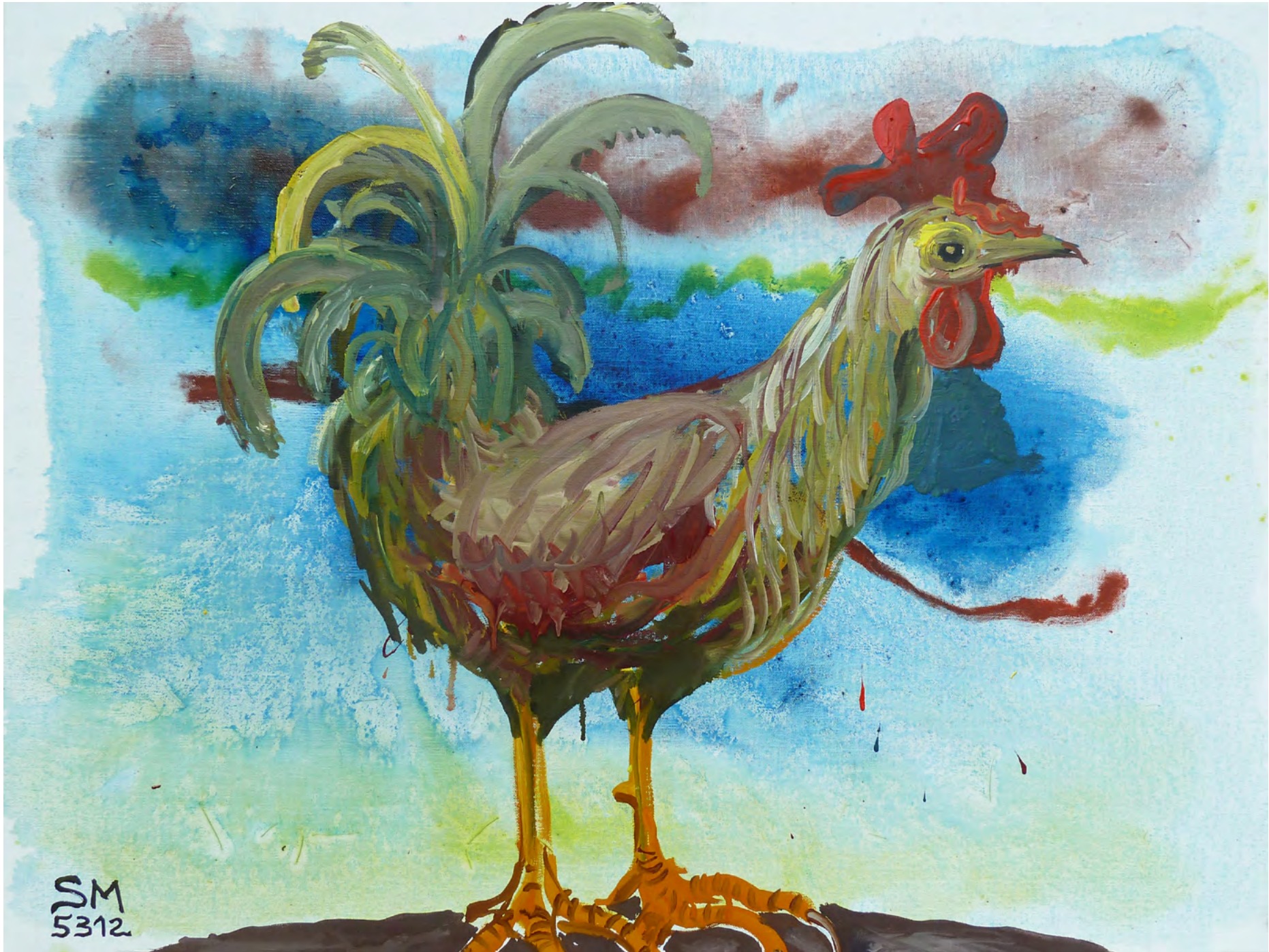
KOM, HAHNGOTT, Mixed media on Canvas, 80 x 60 cm, 2012