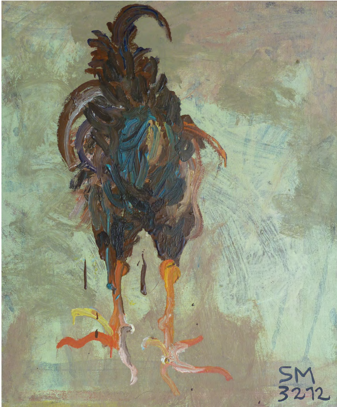
HAHN VON HINTEN, Oil on Canvas, 50 x 70 cm, 2012