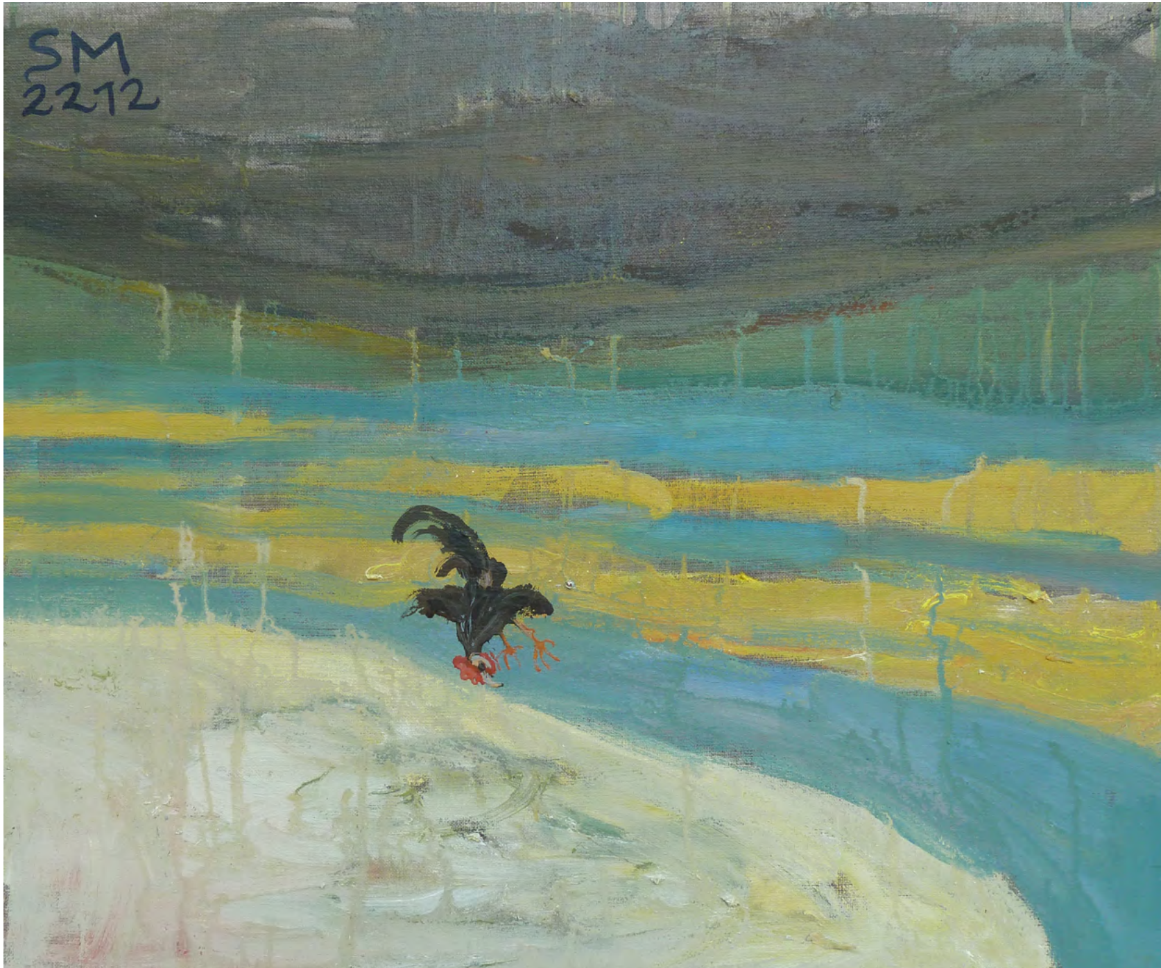
HAHN IM FLUG, Oil on Canvas, 50 x 40 cm, 2012