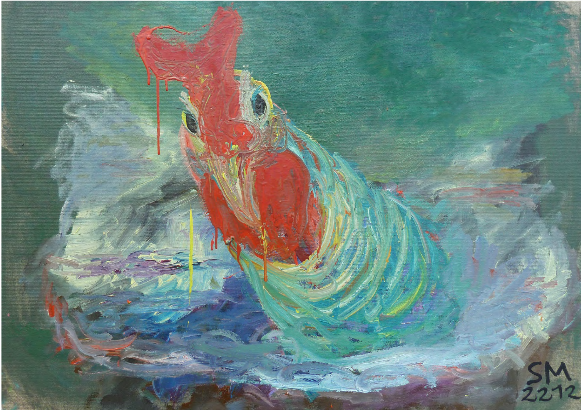
DER HAHN SCHAUT ZU, Oil on Canvas, 70 x 50 cm, 2012