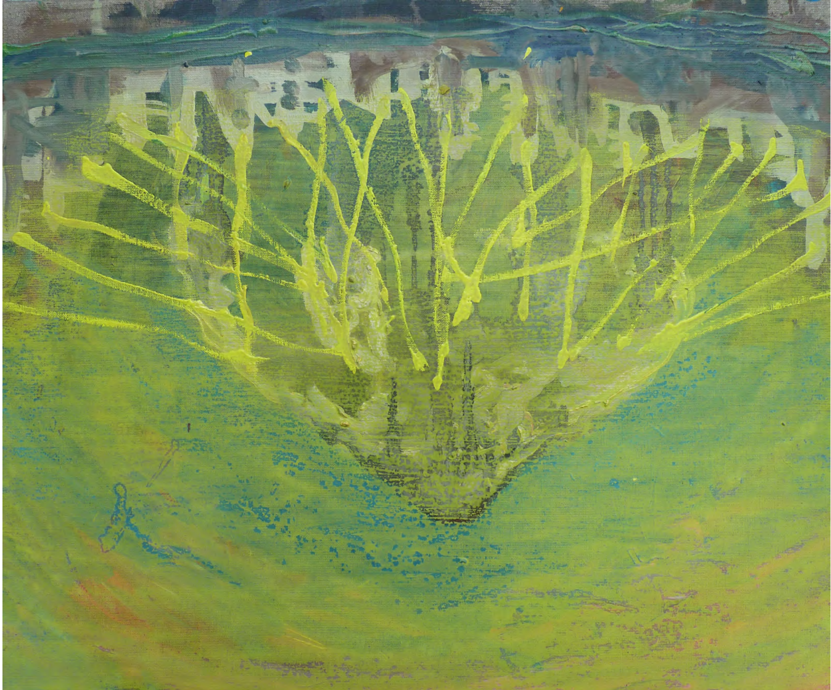
OT VI, Oil and Acrylic on Canvas, 50 x 40 cm, 2012