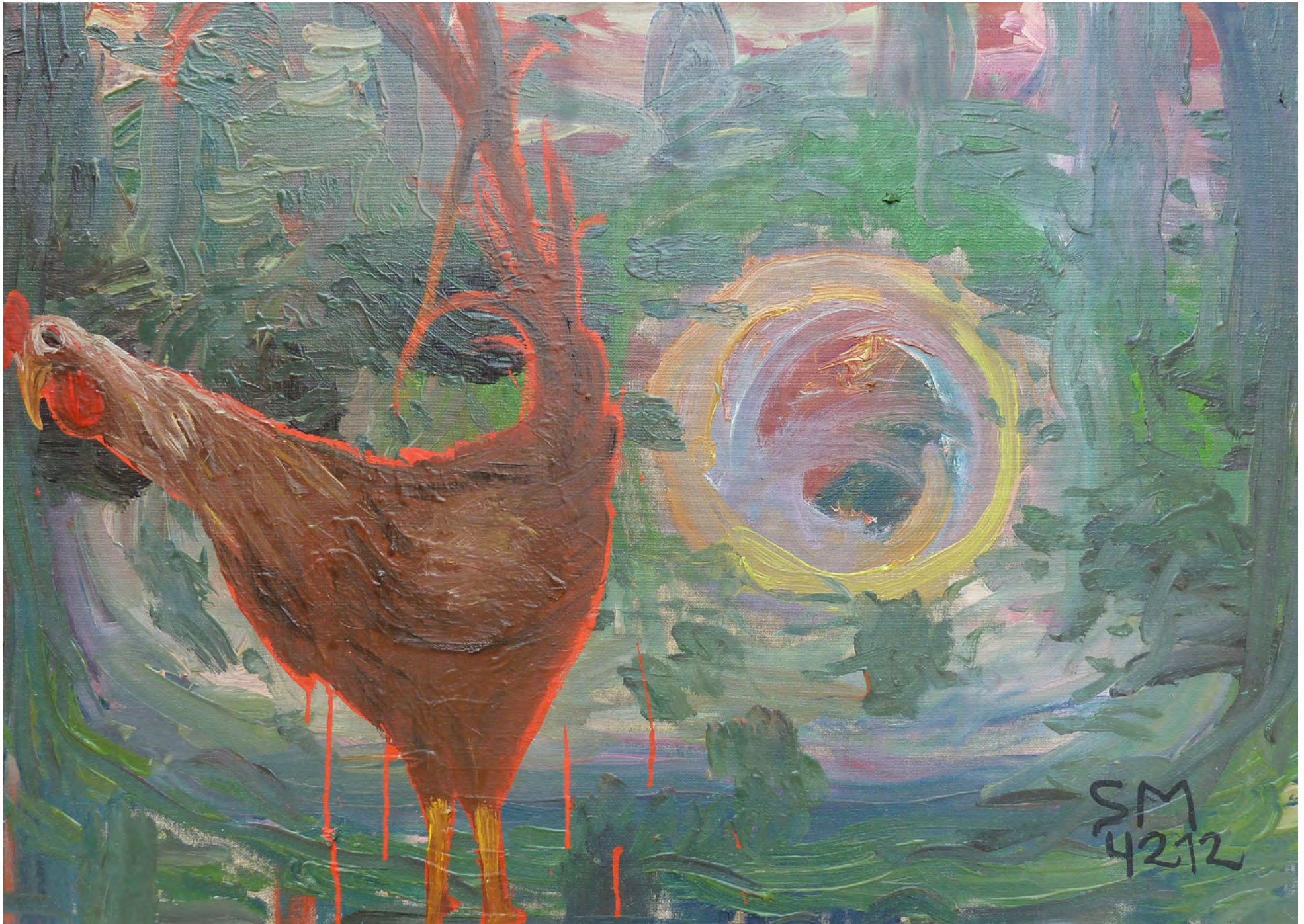
EIN HAHN SIEHT ROT, Oil on Canvas, 70 x 50 cm, 2012