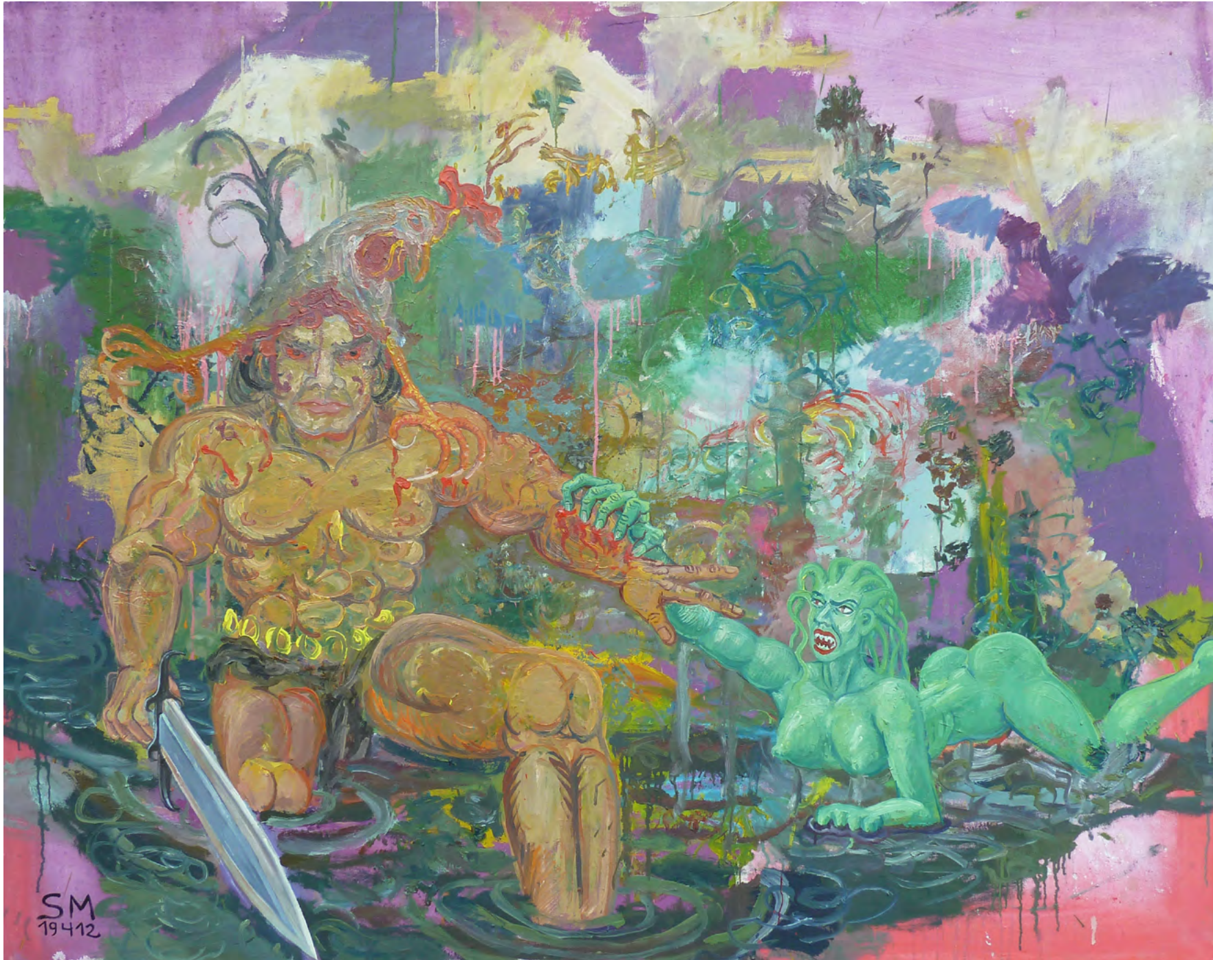
KONAN OF THE KOCKS, mixed Media on Canvas, 185 x 145 cm, 2012