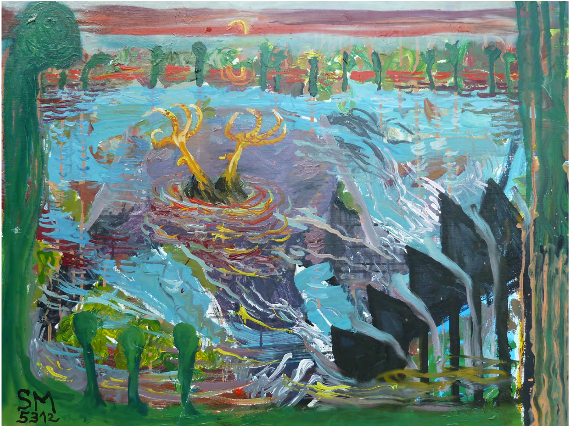
DER HAHN SCHWIMMT, Mixed media on Canvas, 80 x 60 cm, 2012