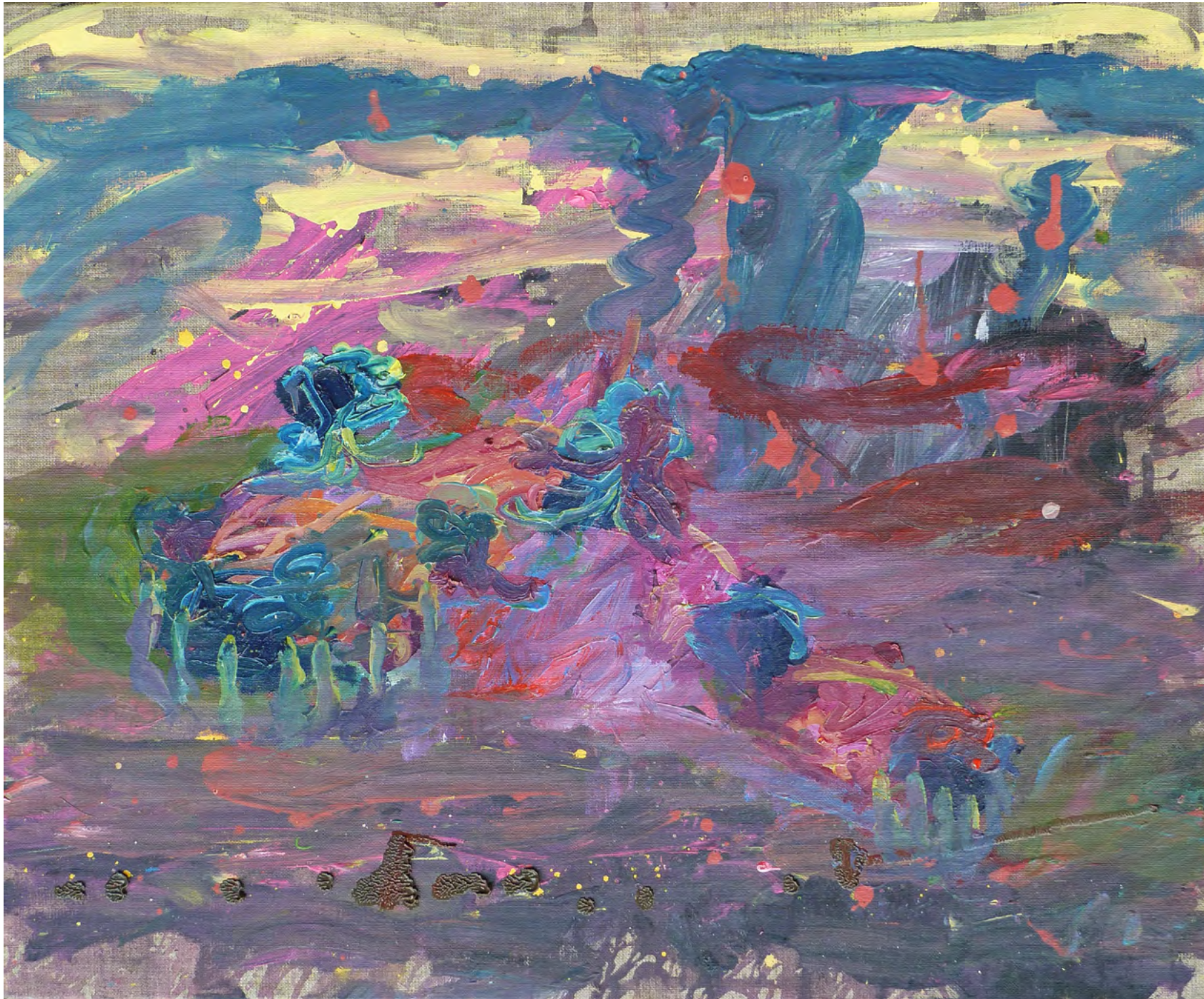
OT V, Oil and Acrylic on Canvas, 50 x 40 cm, 2012