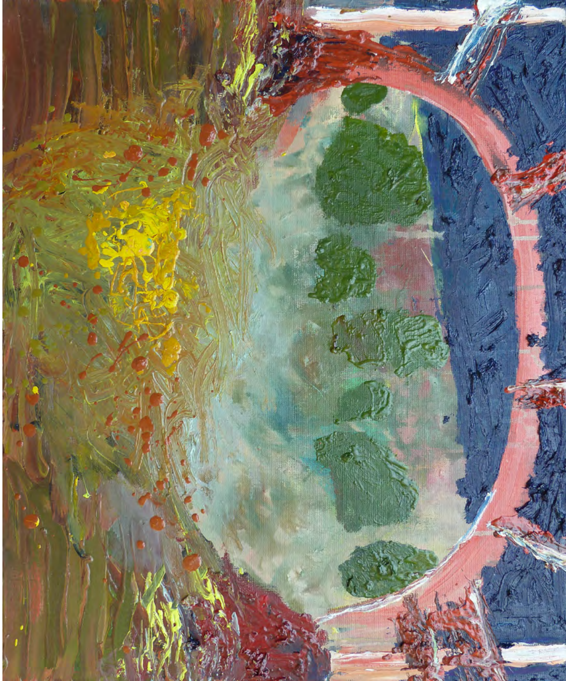
OT VII, Oil and Acrylic on Canvas, 50 x 40 cm, 2012