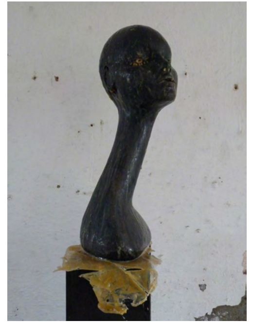
NAOMI, Latex on Styrofoam, wood, paint, 189 x 24 x 24 cm, 2011