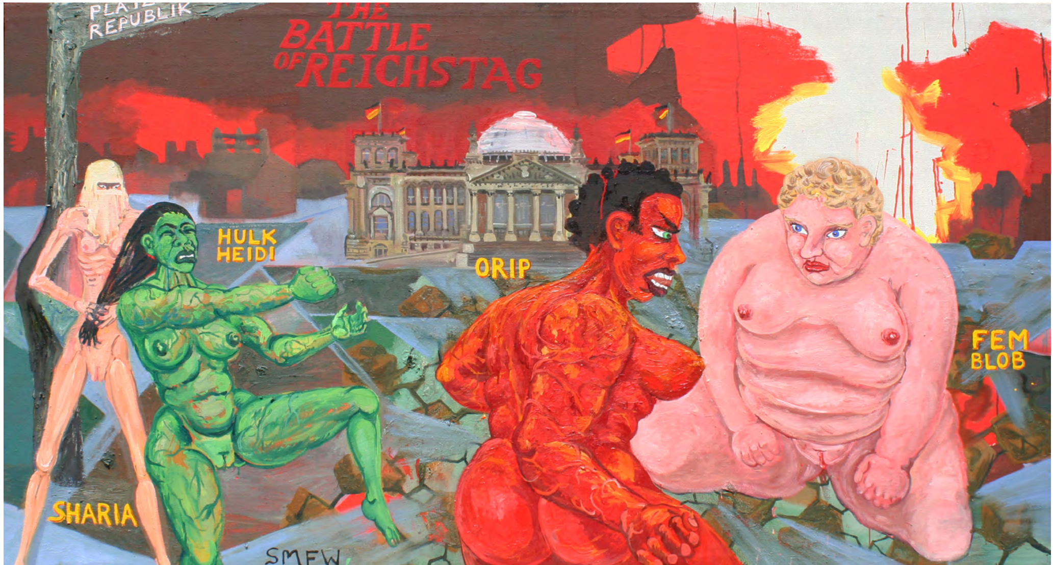
THE BATTLE OF REICHSTAG, Oil on Canvas, 185 x 100 cm, 2011