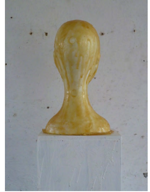
ESTELLE, Latex on Styrofoam, wood, paint, 196 x 24 x 24 cm, 2011