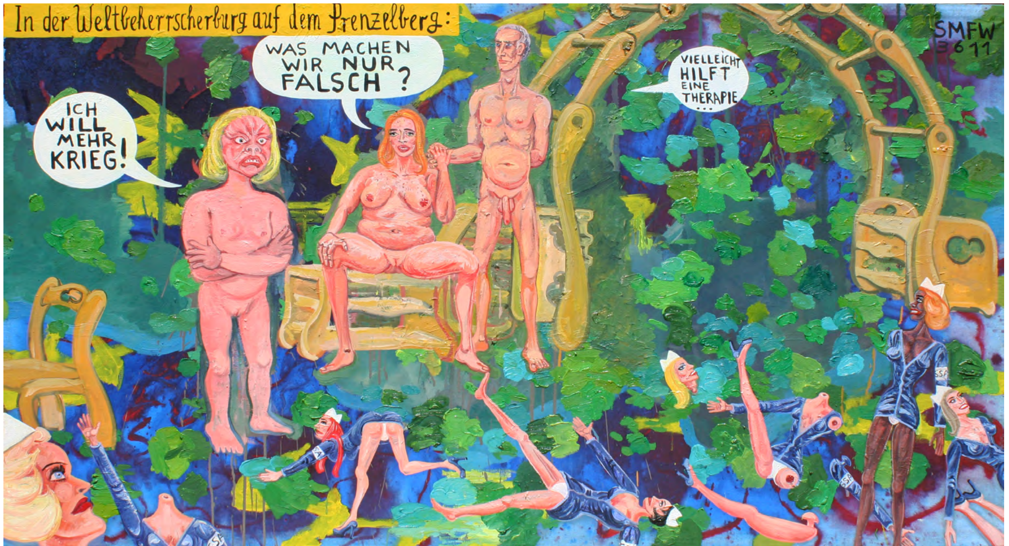
IN DER WELTHERRSCHERBURG, Oil on Canvas, 185 x 100 cm, 2011