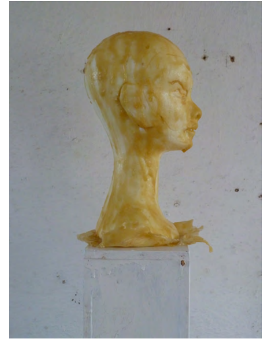
SHANA, Latex on Styrofoam, wood, paint, 187 x 24 x 24 cm, 2011