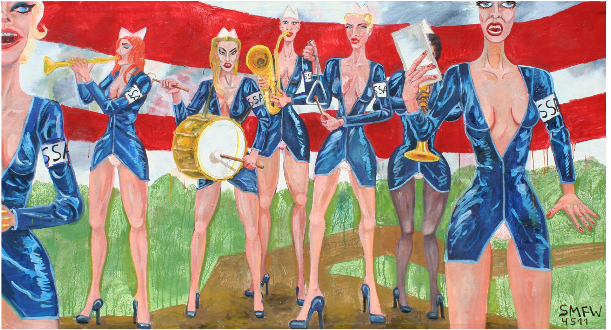
SUPERMODELSALVATIONARMY, Oil on Canvas, 185 x 100 cm, 2011