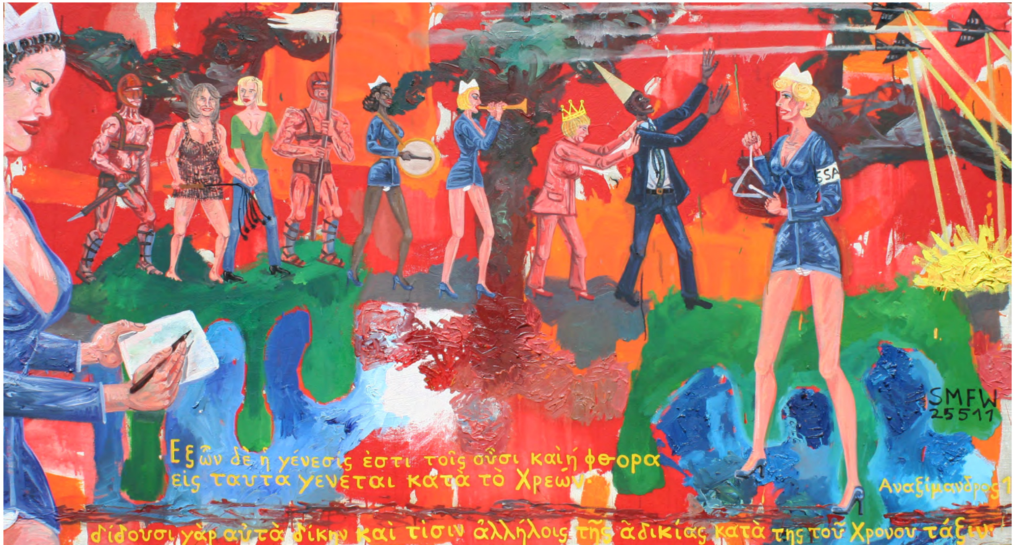
DER SPRUCH DES ANAXIMANDER, Oil on Canvas, 185 x 100 cm, 2011