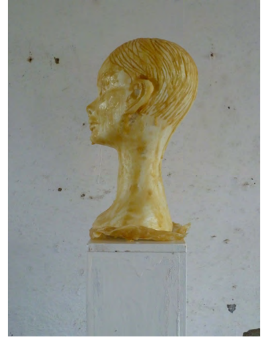
LINDA, Latex on Styrofoam, wood, paint, 192 x 24 x 24 cm, 2011