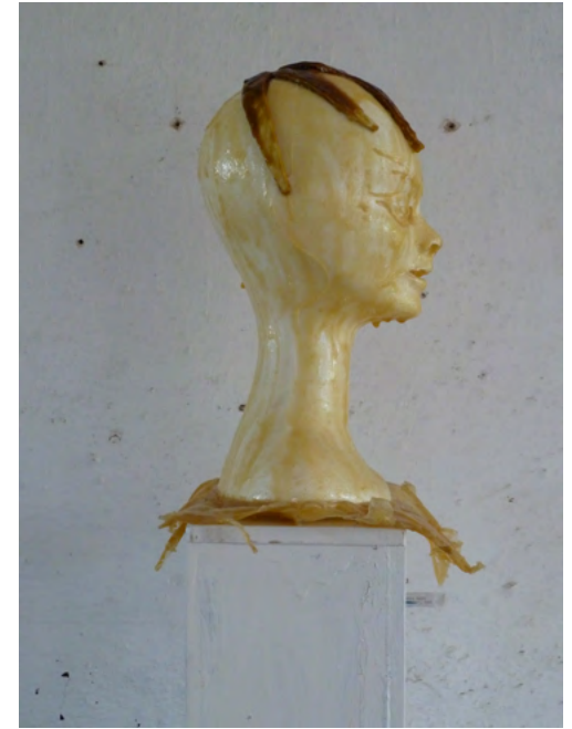
NADIA, Latex on Styrofoam, wood, paint, 183 x 24 x 24 cm, 2011