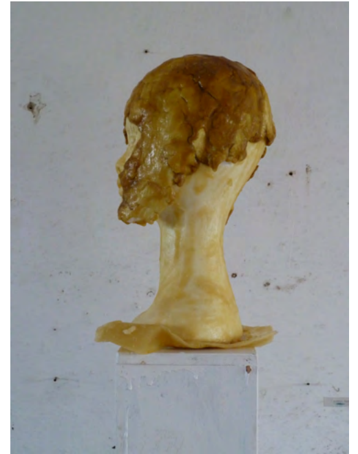
EMMA, Latex on Styrofoam, wood, paint, 177 x 24 x 24 cm, 2011