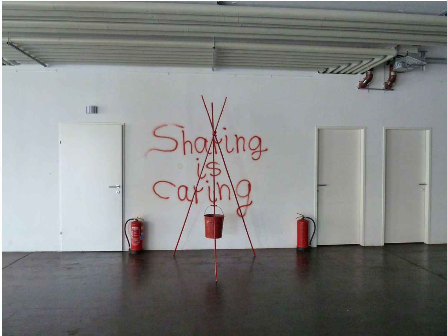
SHARING IS CARING, Spraypaint, Wall, bamboosticks, bucket, chain, fire-extinguishers, 600 x 400 x 250 cm, 2011