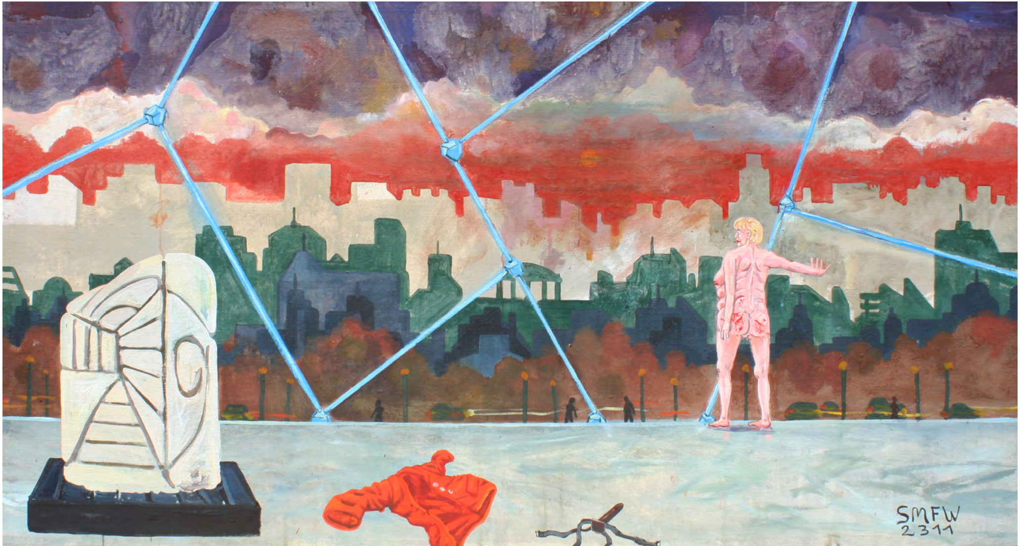
DIE EINSAMKEIT DER MACHT, Oil on Canvas, 185 x 100 cm, 2011