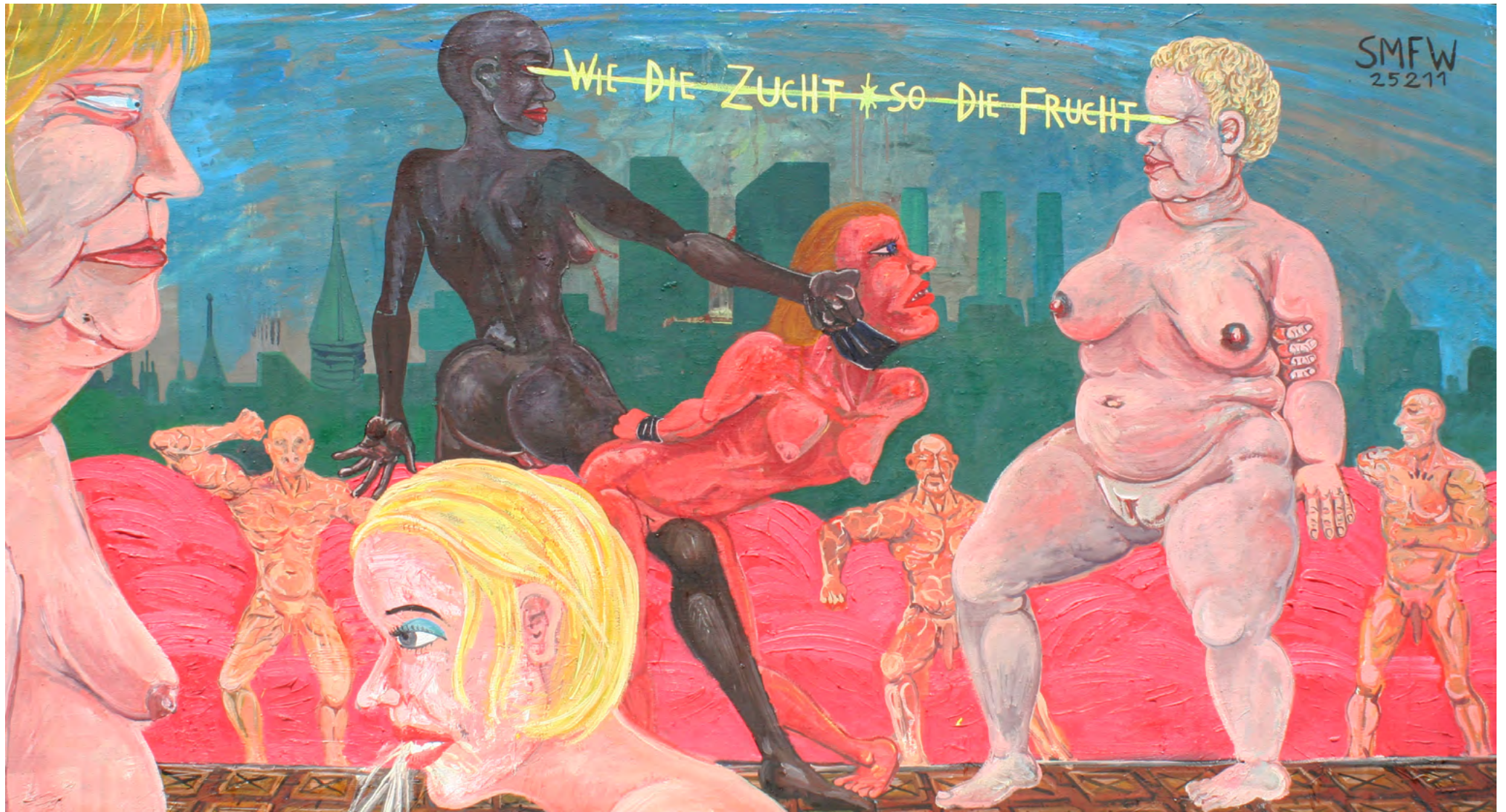
SKY LOBBY SLAVE TRADERS, Oil on Canvas, 185 x 100 cm, 2011