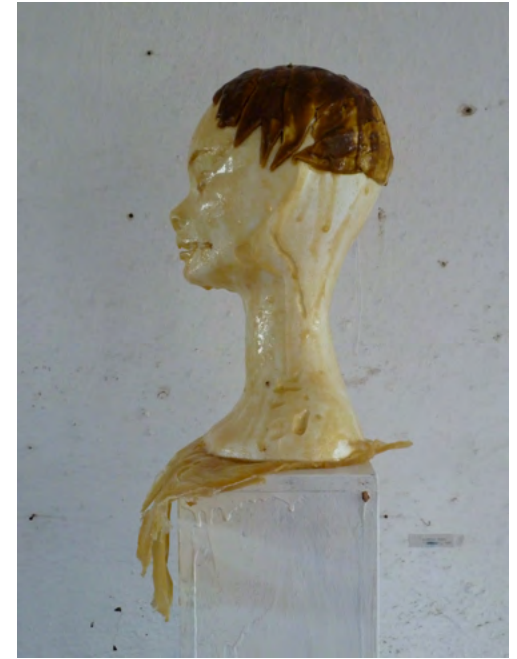
TYRA, Latex on Styrofoam, wood, paint, 188 x 24 x 24 cm, 2011