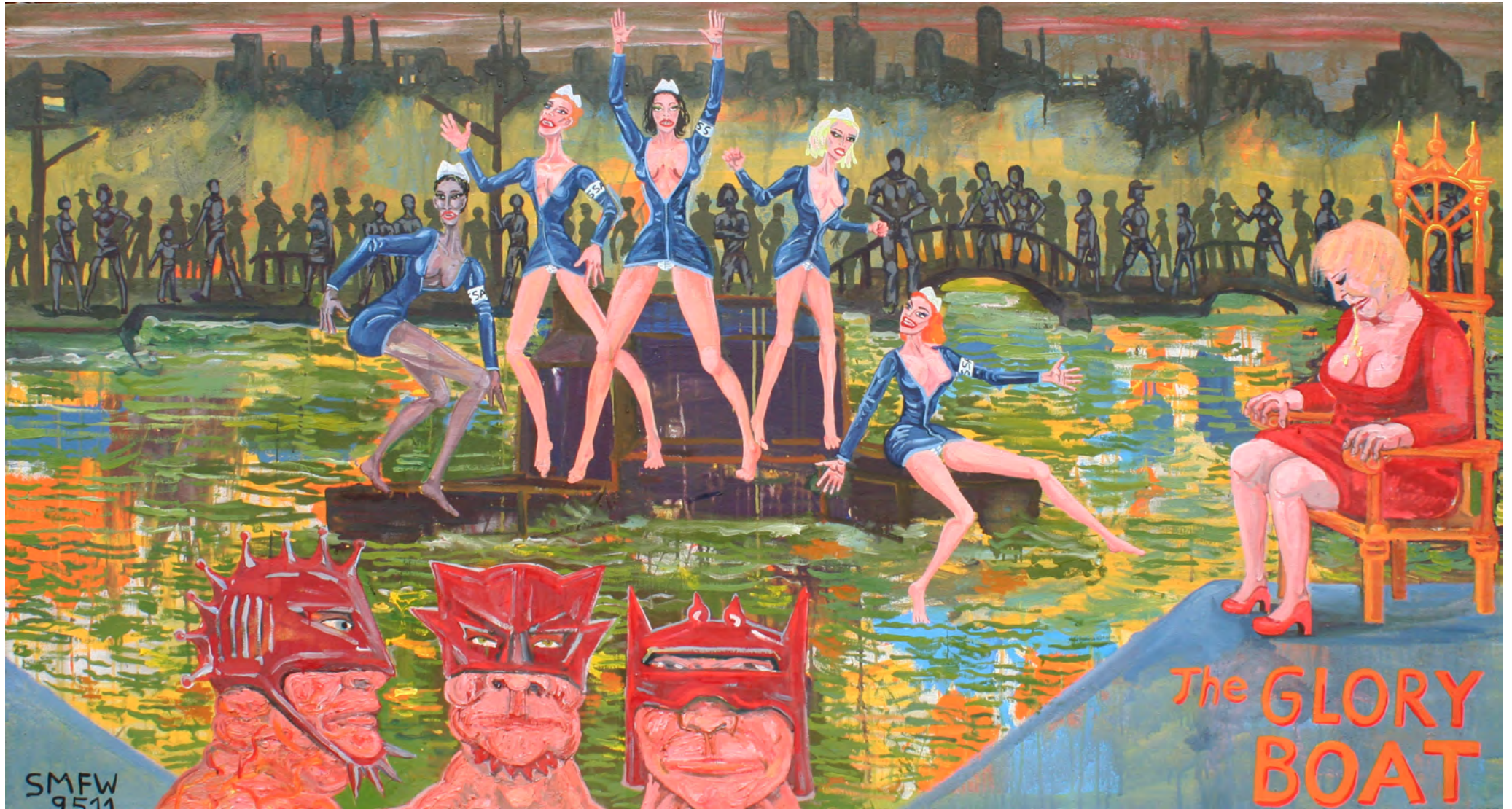
THE GLORY BOAT, Oil on Canvas, 185 x 100 cm, 2011